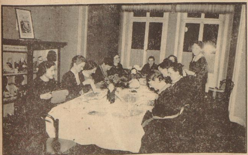
Und wie man kleine Bastelarbeiten für die Kinder macht — das alles, Volksgenossin, lernst du in den zahlreichen und vielgearteten Kursen des Deutschen Frauenwerks.