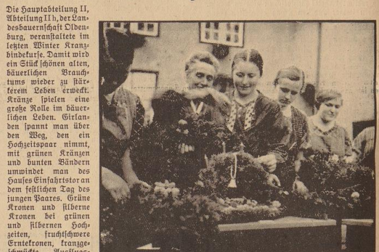
Ein Bild vom letztjährigen Kranzbindekurs in der Bäuerlichen Frauenschule auf Schloß Neuenburg.

solte, in das Lannengrün hineinzufragen als Gruß des Hofes? Oder gar zur Borweihnachtszeit! Sie ist gar nicht denken ohne Kränze und schlichten Grün-schmuck. So wie man einem Menschen in der Fremde mit einem Kranz Schwarzbrot aus der Heimat die größte Freude bereiten kann, so geht es auch mit einem Adresszettel oder sonstigen hübschen Schmuck. Nur einen Kranz von heimischer Erde, von Lannengrün aus dem heimatischen Wald, von Winterzweigen und Sturmglocken muß jeder Kranz mitbringen in die Fremde. Das Kranzbinden ist auf dem bäuerlichen Hof eine schlichte Kunst, ein altes Brautstum. Als solches wird es jetzt von der Abteilung II mit betreut und unseren jungen Bäuerinnen wieder nahegebracht. Sie.