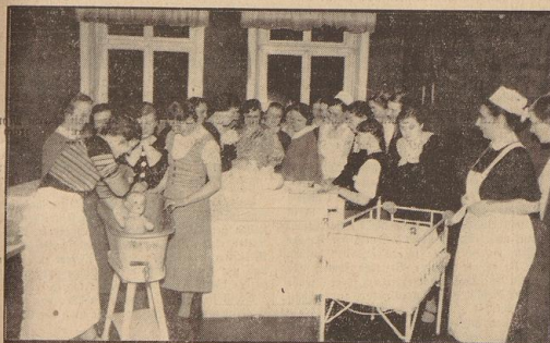
Wie man die Säuglinge richtig pflegt...