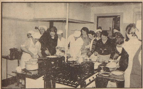
Wie man ein schmackhaftes und billiges Gericht herstellt...