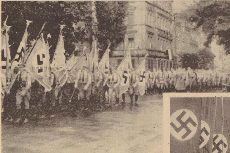
Bild oben: Von Tausenden auf das freudigste begrüßt ziehen die Fahnen unseres Gaus durch das festlich geschmückte Nürnberg.