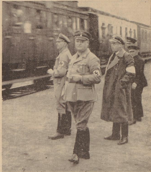
Bild oben: Gauleiter Carl Röver auf dem Bahnhof Fürth in Erwartung des Bremen-Delmenhorster Sonderzuges.