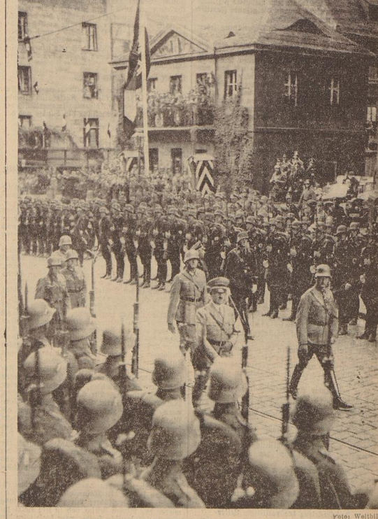
Der Führer schreitet die Front der Ehrenkompanie der Wehrmacht ab.