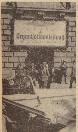
Bild unten: Politische Leiter aus Bremen vor dem Gebäude der Organisationsleitung des Gaus Weser-Ems.