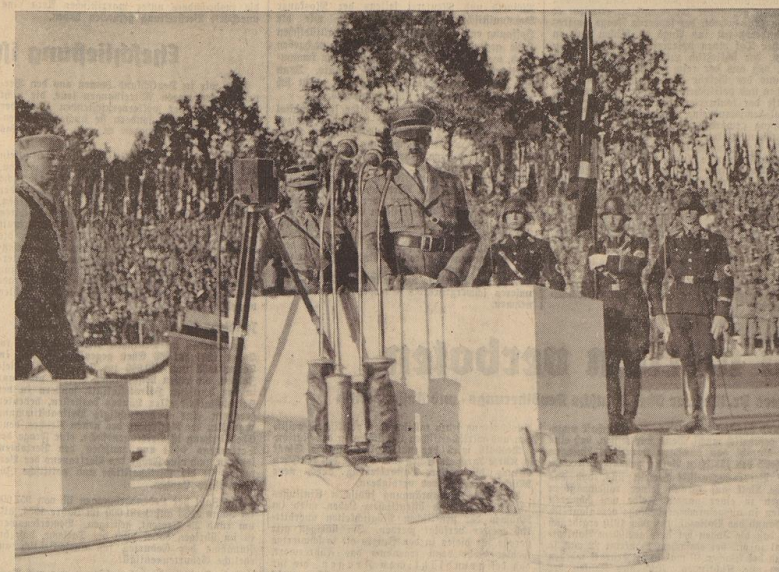
Der Führer bei der Grundsteinlegung der neuen Kongreßhalle, für deren Bauzeit acht Jahre vorgesehen sind.

Der Sturm der Internets unserer Tage ist die gleiche Erscheinung wie die Bedrohung der ersten Welt von 1914. Die Form der Bedrohung der Völker im 20. Jahrhundert trägt den Namen Bolschewismus.