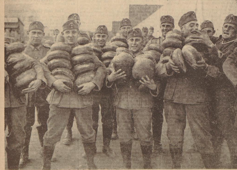
Brotpfanzug im Reichsheerlager in Gehrersdorf (Bild unten). Lachend wird von unseren Feldgrauen die recht beträchtliche Tagesration in Empfang genommen.