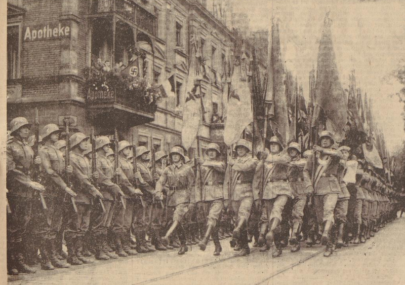
121 Wehrkriegerfahnen auf dem Reichsparteitag (Bild oben). Der Infanterieführer VII hat für den Reichsparteitag 121 alte Feldzeichen der Armee angefordert, alles Fahnen rühmlicher Regimenter, die im Weltkrieg das Ehrenkreuz erritten haben. Am Montagmorgen wurden die Fahnen von der Wohnung des Divisions-Kommandeurs General Ritter von Schober zum Lager der Wehrmacht gebracht. Unser Bild zeigt den Parademarsch der Fahnenkompanie. — Brotpfanzug im Reichsheerlager in Gehrersdorf (Bild unten). Lachend wird von unseren Feldgrauen die recht beträchtliche Tagesration in Empfang genommen.

Die Wachtuppe Berlin marschierte Dienstagvormittag mit ihrem Spielmanns- und Musikzug zum Lager des Reichsheeres in Gehrersdorf durch die Straßen Nürnbergs zum Schachspielplatz, so im Grand-Hotel, dem Sitz der höchsten Führer des Reichsheeres, während des Parteitages die Wachtuppen aufziehen. Nach einem kurzen Standortspiel ging der Marsch der Wachtuppe durch die Innenstadt über den Adolf-Hitler-Platz zur alten Schanz vor dem Rathaus, wo nach alter Tradition eine würdevolle Parade abging. Die Wachtuppe wurde auf ihrem Wege durch die Stadt überall von der Bevölkerung und den zahlreichen Parteilagssteilnehmern begeistert begrüßt.