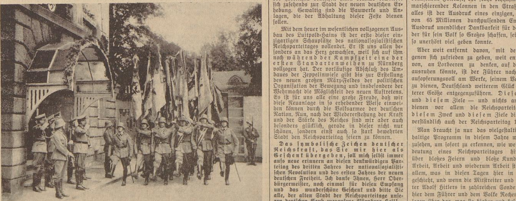
Wehrkrieger-Feldzug auf dem Reichsparteitag. Der Infanterieregiment VII hat für den Reichsparteitag 121 alte Feldzeichen der Arme angeordnet. Unser Bild zeigt den Abmarsch der Fahnen vor der Wohnung des Divisions-Kommandeurs General Ritter von Schobert.