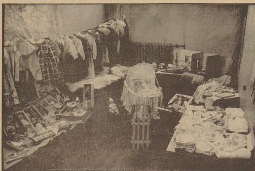
Blick auf die Fülle der verfertigten Dinge. Anst.: Schooner

Nachahmenswertes Beispiel der weiblichen Gefolgschaftsmittigkeit des Telegraphenamtes