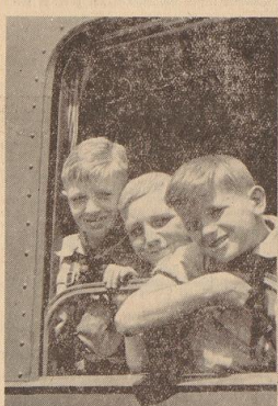
Reisefreunde auf allen Gesichtern