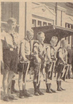
Abschied von Bremen vor dem Lloydbahnhof