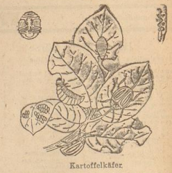
Kartoffelkäfer. Skizze: Biolog. Reichsanstalt für Land- und Forstwirtschaft

Nur durch rechtzeitige Entfernung einiger Raupen sowie rechtzeitigen Einlass aller Maßnahmen des deutschen Pflanzenschutzes ist es im vorigen Jahre gelang, den in Norddeutschland fast ohne Schmetterlinge genannten Käfer (als Kartoffelkäfer genannt) rasch wieder zu vernichten. Da die Ausbreitung dieses gefährlichen Kartoffelkäfers in einigen Nachbarländern Deutschlands immer mehr zunimmt, ist auch in diesen Jahre wieder die Gefahr der Einschleppung gegeben. Es ist deshalb unbedingt notwendig, überall auf das Auftreten des Kartoffelkäfers zu achten.