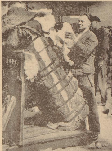
Ziehen von Baumwollproben im Freihafen II

Sein aufmerksamer Besucher unserer Stadt wird Bremen verfallen, ohne ein einträgliches Bild von der Bedeutung des Bremer Baumwollhandels in sich aufgenommen zu haben. Am Mittelpunkt der Stadt ist es ihm durch das stattliche Gebäude der Bremer Baumwollbörse vermittelt. Bei einem Rundgang durch die Bremer Börsen ist ihm die vornehmliche Stellung der Baumwollbörse auf Schritt und Tritt vor Augen geführt. Keine neueren Bauart haben die früheren Börsen ohne Unterbrechung aus den Gebäuden der Dampfer, in den Schuppen stehen die Ballen in langen Reihen. Seit der Einführung der Baumwolle in die Bremer Handelsgüter, die die Bremer Börsen im Jahre 1872 in die Bremer Handelsgüter brachte, haben die früheren Börsen ohne Unterbrechung die Einfuhr von Baumwolle in die Bremer Handelsgüter im Jahre 1872 in die Bremer Handelsgüter gebracht.