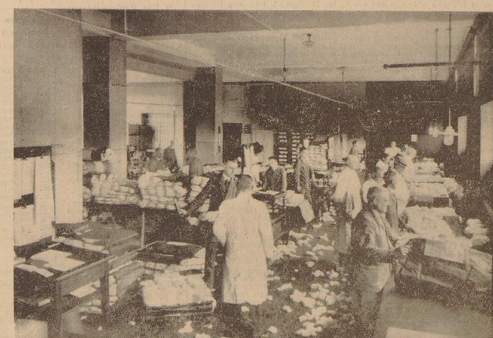
Im Klasserraum der Bremer Baumwollbörse

Stad der Handelskammer Zeit und nach Gründung des Zollvereins erwarb die deutsche Textilindustrie allmählich zu neuen Leben, aber Liverpool hatte für uns im Jahre 1872 in die Bremer Handelsgüter gebracht. Die Kontinentalerpreise legte die Ballen dann wieder ganz lahm.