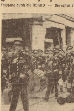
Die Kapelle der Flamen auf dem Marsch durch die Stadt

Empfang durch die HNSD - Die ersten Einzugscheine von nationalsozialistischen Deutschland