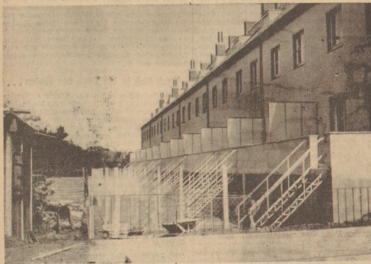
Rückseite der Häuser mit Balkon und Garten

Wir wollen zur Genuge, wie es beschaffen ist mit dem Besitz eines eigenen Heimes, auf dem einen feinen Mensch etwas zu legen hat. Wir müssen auch, wie gründlich vorgegangen wird, damit nach und nach ein jeder in die Lage komme, ein Stückchen Erde für sich zu nennen. Das Staat treibt da großzügigste Vorzüge — die Stadtratsmitglieder zeigen davon — und die einzelnen Gesellschaften sind nicht minder eifrig dabei, dem Schicksal nach Neubauwohnungen und der Notwendigkeit der künftigen Arbeitsbeschaffung Rechnung zu tragen.