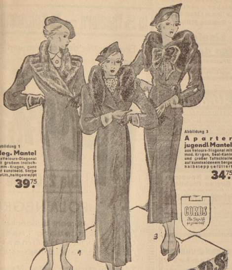
Abbildung 1 Eleg. Mantel aus Velours-Diagonal mit großem hochschal- lam-Kragen, ganz aus kunstleder, Serpe gedr., halbstappt 39,75