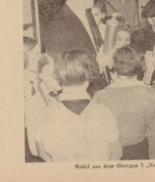
Miel aus dem Obergraben 7. Nordsee - Anhang: Bildreihe III - Gebiet 7 - Nordsee.

Die Führerfahrt des Jugendjahrs 2/75 war ein großer Erfolg. Die Jugendlichen haben durch ihre Teilnahme an der Führerfahrt ihre Kameradschaft gestärkt und neue Freizeitmöglichkeiten entdeckt. Dies hat zu einer Steigerung der Leistungsfähigkeit und der Ausdauer geführt. Die Jugendlichen sind nun in der Lage, auch bei schwierigen Bedingungen erfolgreich zu sein. Dies ist ein wichtiger Schritt zur Selbstverwirklichung und zur Entwicklung der Jugendbewegung.