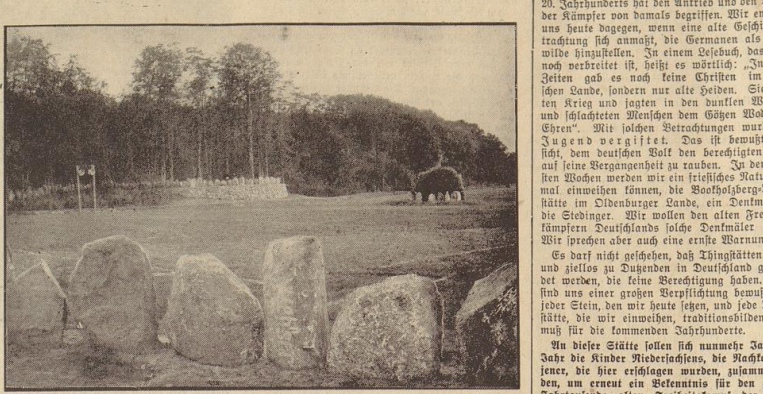
Die Thingstätte im Sachsenhain

Die Sonntagsvorlese der G.G. im Sachsenhain bei Verden