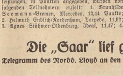
Frachtmotorschiff „Saar“ kurz vor dem Stapellauf

Telegramm des Nord. Lloyd an den Saarrückgliederungs-Kommissar Bärde