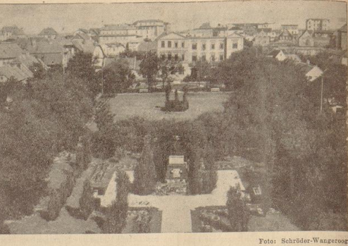
Blick in den Kurpark des Nordseebades Wangerooze