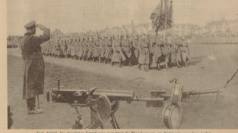
Nach Schluß der feierlichen Vereidigung marschiert die Ehrenkompanie am Divisionskommandeur vorbei