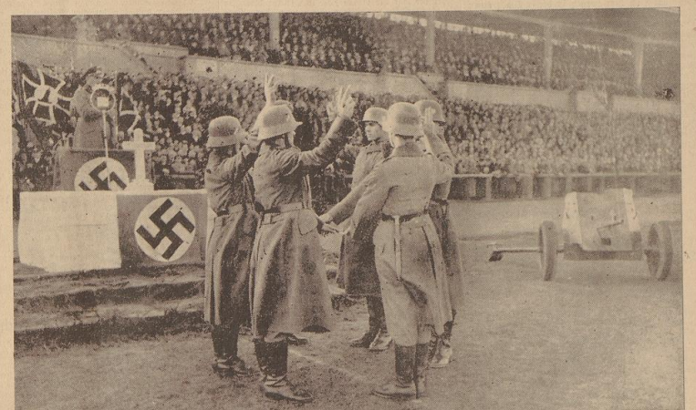
Während die Abgeordneten aus jeder Abteilung den Eid auf den Degen ablegen . . .