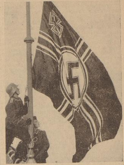
Überall auf Deutschlands Kasernen ging um 8 Uhr morgens die Reichsflagge hoch.