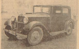
Das von den Tätern benutzte Auto