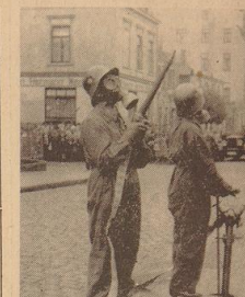
Ein Gasvergifteter wird über einen Zaun geschleift.

Energie und Findigkeit. In hohem Bogen fliehet der Bombenflug auf die brennenden Häuser. Die Luftschutzorganisationen sind in Alarmbereitschaft versetzt, die Bevölkerung ist in Alarmbereitschaft versetzt.