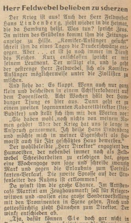
Herr Feldweibel belieben zu schreien