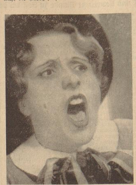
Leonore, die Stimme aus dem Kinderreich

„Aber das haben Sie ja gar nicht“, protestiert sie lächelnd. „Im Gegenteil, ich freue mich über unsere Unterhaltung. Schließlich . . . ich bin ja nicht die Carlo.“