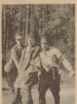
Ein „Leichtverletzte“ wird zum Verbandplatz getragen

Saniäter-Gelände-Übung des NSKK, Motorstaffel II/M 62