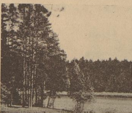
Die Schönheit des deutschen Ostens: Blick auf den Tatzensee

Nationalsozialist ist Ostpreußen ein herrliches Land. Kleine Bodenbehebungen, Wald, herrliche Getreidefelder und Seen. Auf einem Fußmarsch durch das Ostpreußenland bekommt man immer ein neues landschaftliches Bild. In den Wäldern tauchen plötzlich hier und da kleine Heidegebirge auf, die die Namen deutscher und russischer Krieger tragen. Es kommt einem dann plötzlich zum Bewußtsein, mit wieviel Blutvergießen das Ostpreußenland bebaut wurde.