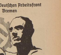
Schule der Deutschen Arbeitsfront Bremen