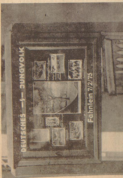
Attn. Bildnis des Jungmanns 275.