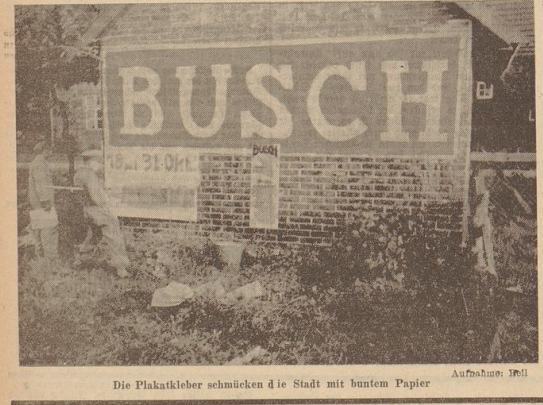
Die Plakatkleber schmücken die Stadt mit buntem Papier