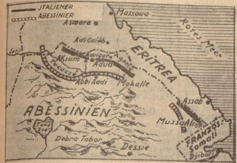
Die Fronten in Nordabessinien. (Auf Grund der Meldungen aus Kom. Adhla Ababa und London.) (Wagenburg-Eisner — L.)

Verstärkter Einmarsch von Bombengeschwadern an der Ogaden-Front