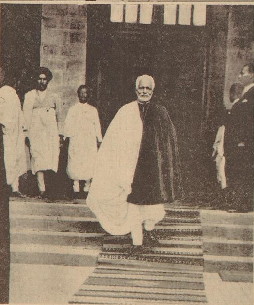
Das abessinische Kriegsministerium veröffentlicht das kaiserliche Palast in Addis Ababa