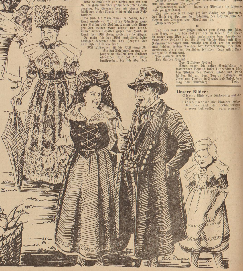
Unsere Bilder: Oben: Blick vom Büdeberg auf die Weser. Links unten: Die Pioniere erlei- chen das Ziel der Schaulungen unserer Luftwaffe.

Und nun wird der Hügel wieder zum Sonn, zur Höhe, zum Berg, — und das Tal zur breiten Ebene. Die Weser ist neben dem Weg und nicht mehr unter dem schwellenden Bild. Eine Straße ist da. Es öffnet sich die Stadt mit ihren fahnenmolempellen und entläßt den Volk, der sich umficht nach solchen frohen Treiben der Vorbereitung. Der Be- reitung, die einem herrlichen festlichen Tage gilt: Dem morgigen ist Erntedank! Des Bauern Arbeit! Des Landes Segen! Des Städters Leben! Schon ragen die ersten Erntekränze im flatternden Schmut ihrer Bindbänder über den Pfählen der Dörfer, Stadt und Land schönen sich an, dem Tag zu ludigen, in Dank und Demut, in Freude und Jubel, dem Tag non Büdeberg. Tsch.