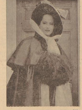
Marie Oberon als Baby-Mädchen in dem Film: „Die schlaraffenland Blume“, der dieser Tage in Bremen läuft. Besprechung des ausgezeichneten Bildstoffs siehe an anderer Stelle des Blattes.

Das deutsche Sprachsicht auch eine starke Abneigung, selbst durch die einfachste Weiterbildung besondere weibliche Formen der Wörter zu schaffen.