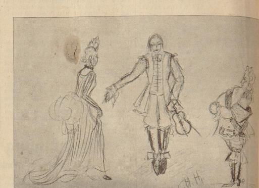
Kostümskizzen von Christof Hartmann

haben ich nicht gedacht. Und jene neunmal Klagen, die nicht mehr läßt sind an ein ehliches einfaches Gefühl zu glauben, die hinter jedem Wort nach der alten Sitte des Kurierbüchens die Töne, den verbotenen Zynismus oder die Operatation auf die Sentimentalität wittern, auch auf die mögliche als Publikum gerne verzichten. Mit diesen