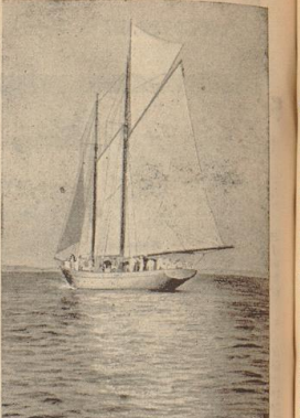
Segelstern mit 'Kraft durch Freude'