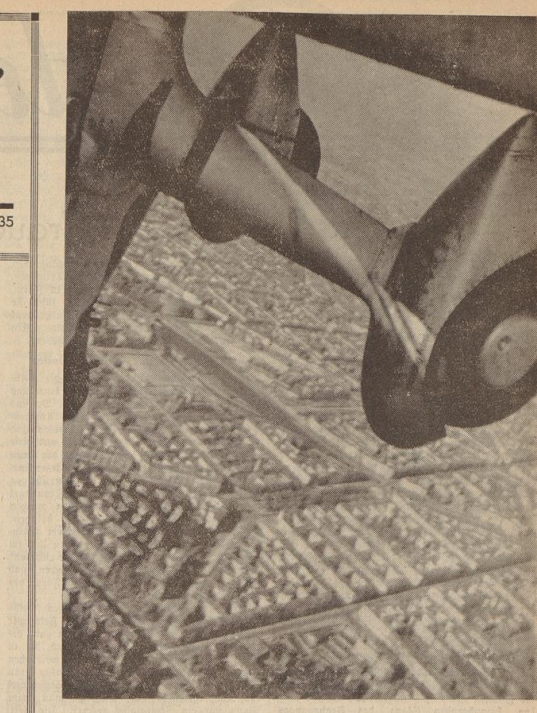
Als Auftakt zur Reichsluftwoche gelangt in Bremen in kommender Woche der große deutsche Fliegerfilm „Wunder des Fliegens“ mit Ernst Udet zur Aufführung.