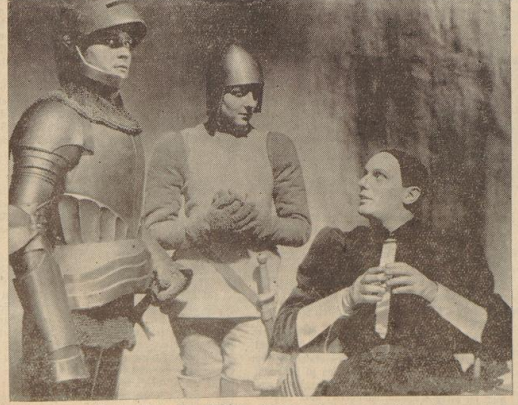
Szeno aus dem Ufa-Film „Das Mädchen Johanna“, der gegenwärtig in Bremen läuft.