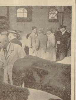
Durch Handschlag wird der Kauf abgeschlossen