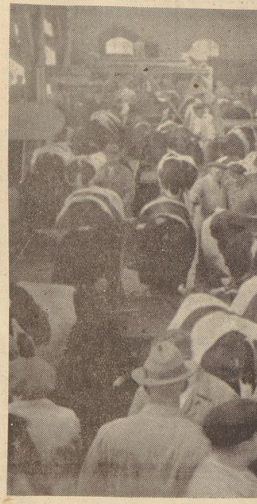
Riesiger Geschäftsbetrieb an dem Bremer Schlachthof

Becken und Wasser in Tätigkeit und draußen stehen die Müllwagen, die sofort alles abfahren. Kein Wunder, wenn in den ganzen Räumen keine einzige Ratte, geschweige denn ein kleines Mäuschen zu sehen ist. Die Markthalle ist so sauber, daß die Schlachthöfe und Fleischereien in sie nicht besonders beliebt, sie stehen sehr oft buchstäblich „in höchstem Grade“. Auch der schärfste Geruch im Bremer Schlachthof gehört seit Jahren der Vergangenheit an. In den letzten Jahren sind Klagen über Geruchbelästigungen über-