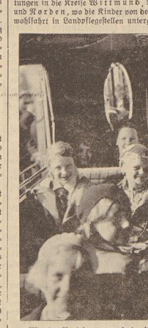
Wie im Vorjahr, so auch in diesem Jahr: Eitel Freude und Erwartung bei allen Klammern.

In diesem Jahr blieb es für die ersten 200 Bre- mer Ferienkinder der NSV, besonders früh ab- fahren, am Höhenortspass warteten die Familien,