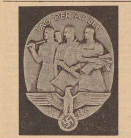
Jeder deutsche Volksgenosse trägt das Mai-Abzeichen!