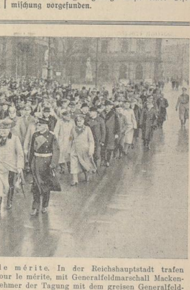
Das Treffen der Ritter des Pour le mérite. In der Reichshauptstadt trafen sich...