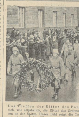
Das Treffen der Ritter des Pour le mérite. In der Reichshauptstadt trafen sich...