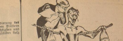
„Nur Mut, Mr. Chamberlain, mit den Boxhandschuhen haben wir's noch immer geschafft.“

Die Veranstaltung „Zeitgenössische Rezepte“ ist ein Thema, das in den letzten Jahren immer wieder diskutiert wurde. Die Veranstaltung „Zeitgenössische Rezepte“ ist ein Thema, das in den letzten Jahren immer wieder diskutiert wurde.