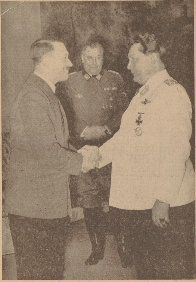
Der Führer bei Generalfeldmarschall Göring. Der Führer stattete am 12. Januar, wie berichtet, Generalfeldmarschall Göring einen Besuch ab, um ihm persönlich seine Glückwünsche zum 47. Geburtstag auszusprechen.

Drei Minuten später stehen der W. D. und die beiden Geschützführer, ein Bootsmannsmaat und ein Matrosen-Schnapsgeliebter, beide von ihren Flut kommend, im Dschungel und Sidewalk vor dem Kommandanten. Er beglückwünscht sie mit Händedruck, deckt die rechte Hand in die Tasche und überreicht dem Hauptgeliebten, dessen Flut die Luftschiff herunterholte, das E. K. II. Der W. D. und der Bootsmannsmaat hatten es bereits früher bei beiden anderen Flut geschossen. Nach der Mitteilung wird der Schnapsgeliebte unter Deck von seinen Kameraden gefeiert. Bis zu uns herauf hören wir ... denn wir jagen gegen England!