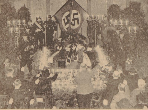
Der Gauleiter grüßt seinen toten Kameraden.