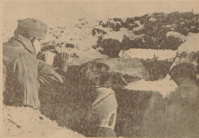
Blick in Feindesland durch die Schießscharte eines Maschinengewehrstandes. Genaueste Beobachtung des feindlichen Geländes ist notwendig, um immer vor Überraschungen geschützt zu sein.