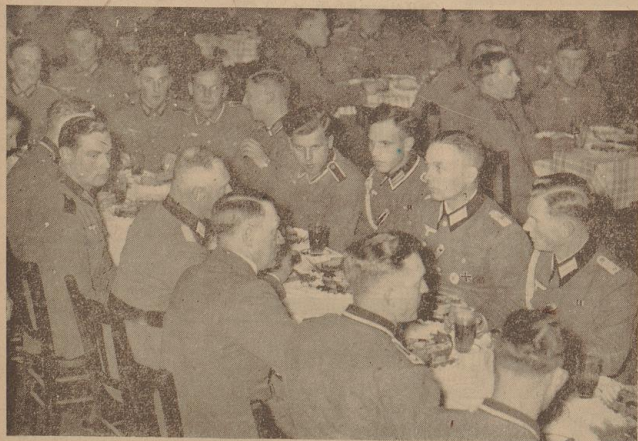
Der beste Kamerad seiner Soldaten. Der Führer, der schon in den Weihnachtsfeiertagen bei seinem Besuch an der Front seine enge Verbundenheit mit der Wehrmacht bekundete, brachte in seiner Neujahrsbotschaft seine und der ganzen Nation stolze Zuversicht auf den Sieg Deutschlands zum Ausdruck.

bei diesem Kampf mit einem Abschluß beteiligt. Er ließ den letzten Engländer fluchtartig den Kamptraum verlassen und jagte ihm nach. Kurs fast 4000 Meter Höhe war der Gegner mehr als 3000 Meter hinausgefahren, doch alles half ihm nicht mehr. Schon beim ersten Angriff stürzte er zerbrochen hinab und flatterte schwer auf die Wellen der Nordsee zu nahe mang, sein Grab finden soll. Das jedenfalls ist der letzte Wille aller Flieger des ruhmreichen Jagdgeschwaders Schümacher, das hier Tag und Nacht an der Nordsee die Wache hält.