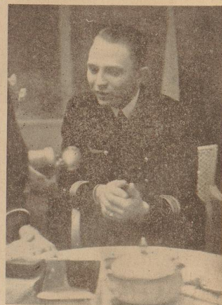
Kapitänleutnant Prien berichtet über seine jüngste Feindfahrt. Der Sieger von Scapa Flow, von den Engländern so oft totgesagt, feierte Weihnachten in der Heimat. Am zweiten Weihnachtsfeiertag gab der erfolgreiche U-Boot-Kommandant für den deutschen Rundfunk eine kurze Schilderung seiner dritten Feindfahrt, auf der er bekanntlich einen Schweren Kreuzer der London-Klasse torpedierte und über 26 000 Brutto-Registertonnen feindlichen Handelsschiffes versenkte. Das Bild zeigt Günther Prien in seiner Wohnung am Mikrophon.

Und der Gefreite G., der sich mit 15 Feindflügeln das Eisenerz Kreuz bereits in Polen geholt hat, war