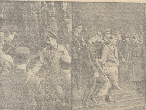
Adolf Hitler (rechts) verläßt nach der Trauerfeier den Dom Der ehemalige Kronprinz (links) während der Trauerfeier im Gespräch mit SA-Führern