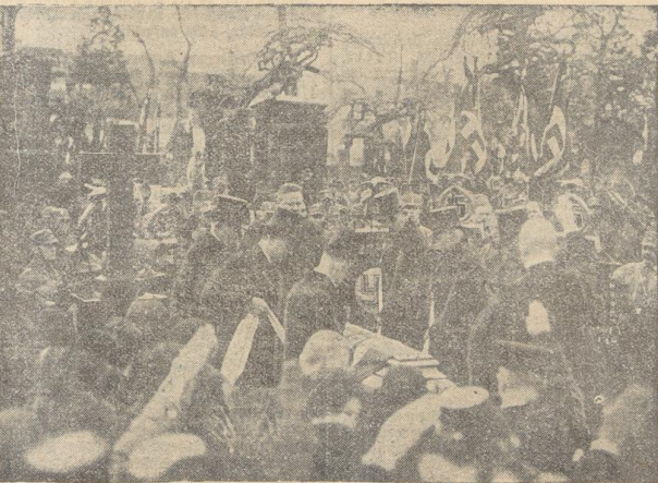
Die Beisetzungsfeier auf dem Invalidenfriedhof