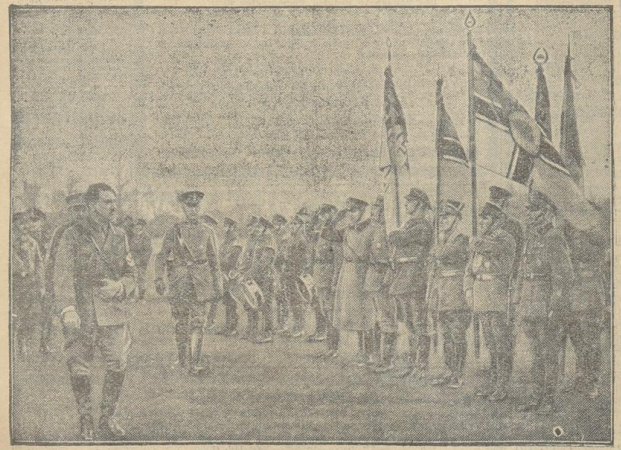
Reichschanzeleiter Götter in München Der feierliche Empfang des Reichschanzeleiters auf dem Flugplatz Oberwieselfeld