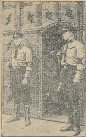
München nach der nationalen Wahl- übernahme Doppelposten der SS-Polizei vor dem Portal des Rathauses