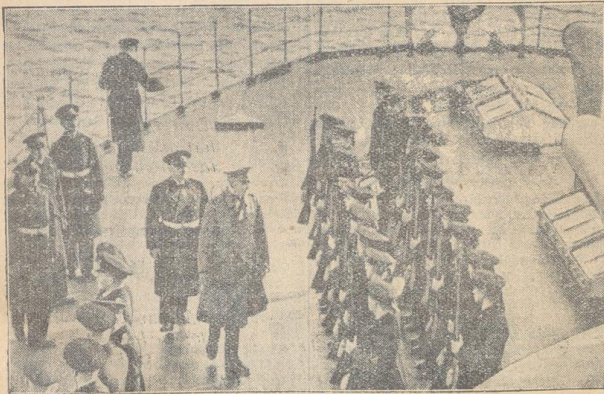
Der Reichswehrminister bei der Marine General von Blomberg und Admiral Glöcklich beim Abgelenken der Ehrenwache an Bord des Flottenflaggschiffs Schleswig-Holstein.