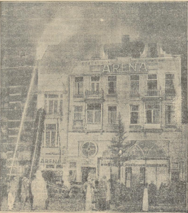
Bild auf das brennende Variete-Theater „Arena“ während der Löscharbeiten

Nachdem endlich der Frost eingestakt hat, ist im Parkhausgarten eine Spritzenbahn angelegt worden, die am gestrigen Eröffnungstage sich bei jung und alt großer Beliebtheit erfreute. Geöffnet von 11-23 Uhr. Vom Parkhaus-Kaffee hell erleuchtet, hat man einen herrlichen Ausblick auf Eisbahn und Stadt. Siehe auch heutige An-