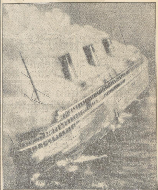
Bildtelegramm von der brennenden „Atlantique“. Die Aufnahme wurde von einem Flugzeug aus gemacht und von Paris telegraphisch nach Berlin übermittel.

Aus den Aussagen der Matrosen und vor allem des zweiten Kapitäns scheint hervorzugehen, daß man einen Kurzschluß als Feuerursache für möglich hält. Handelsmarine-Minister Meyer scheint ebenfalls zu dieser Auffassung zu neigen. Er schaltet jedenfalls von vornherein jeden verbrecherischen Vorfall aus.