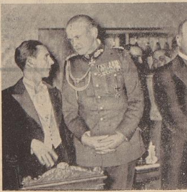
Ein Schappischuß von dem ersten Präsidenten des Vereins Berliner Fecht...