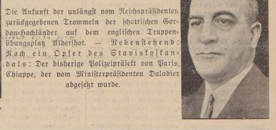
Die Ankunft der Reichspräsidenten...