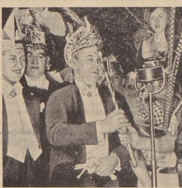
König ermahnte seinen Prinzen Kamehal...