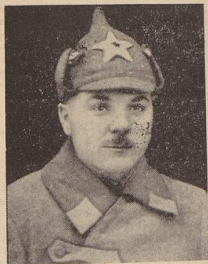
Der russische Kriegskommissar Boris Scholom...