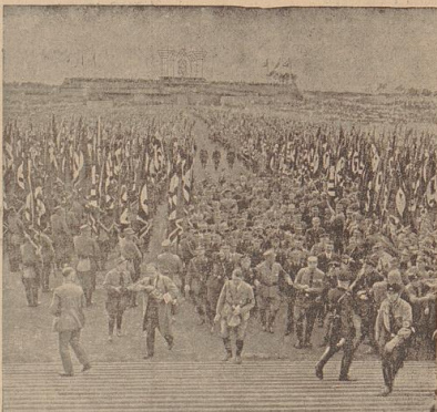
Der Führer verläßt die Zeppelinwiese nach dem großen Amtswaltersperr