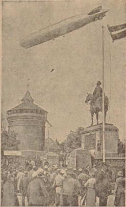
Auch „Graz Zeppelin“ auf dem Reichsparteitag