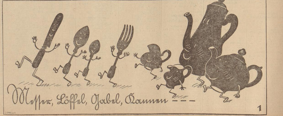
Waffeln, Löffel, Jodeln, Rauschen

Vorsitzender: Ich verpöndere mir auch keinen Erfolg davon, ich habe ja schon so oft danach gefragt.