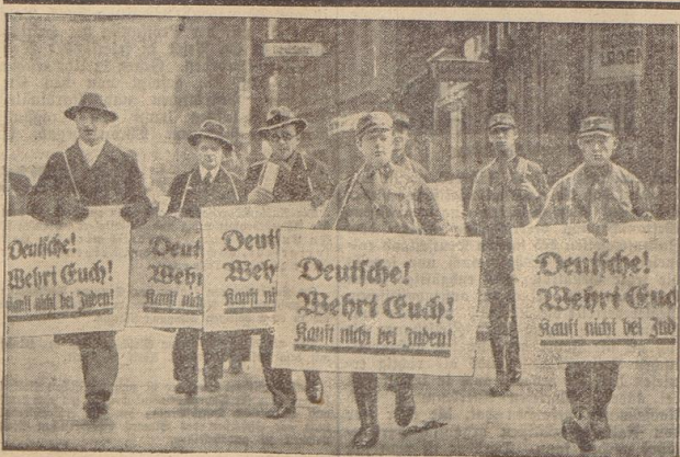
Boycott-Posten, die mit ihren Plakaten vor den jüdischen Geschäften aufgestellt waren in den Straßen Berlins

Der Kampf ist entbrannt. Die Schlacht am Jordan ist seine erste Phase, mehr nicht. Aber gerade darum mußte sie unter allen Umständen gewonnen werden. Das sollte sich jeder sagen, der in seiner traditionellen deutschen Objektivität noch nicht das richtige Verständnis für die Abwehr- und Gegenangriffsformen aufbringen konnte. Auf