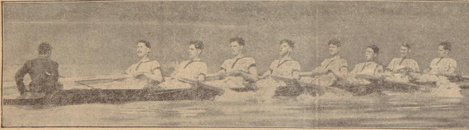
Zum 85. Male Oxford—Cambridge

Das größte Ereignis des englischen Rudersports, der traditionelle Achterkampf der beiden Universitäten Oxford und Cambridge, fand am Sonntag auf der fast 7000 Meter langen Rennstrecke zwischen Putney und Mortlake zum 85. Male statt. Cambridge legte mit 2/4 Längen Vorsprung, links Oxford, rechts Cambridge.