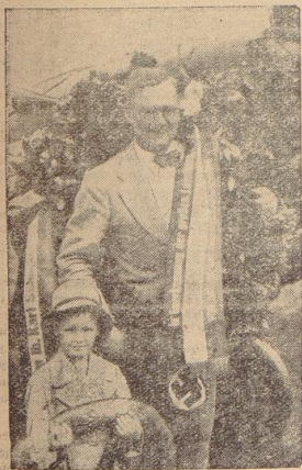
Heimkehr eines deutschen Militär-Pilgers

Turnverein Oberland. Außerordentliche Haupt-Versammlung am Freitag, den 19. Mai 1933, pünktlich um 20.30 Uhr, im Vereinslokal, Tagesordnung: 1. Nächster des gesamten Turnrats. 2. Neuwahl eines Vereinsführers. Ergeben eines jeden Mitgliedes ist Pflicht.