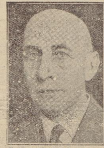
Präsident für Luftschutz ernannt Generalleutnant A. D. Hugo Grimme, der im Weltkriege die deutsche Luftabwehr organisierte und führte, wurde vom Luftfahrtminister Goering zum Präsidenten des deutschen Reichsluftschutzbundes, der Organisation zur Förderung des für Deutschland so notwendigen Luftschutzes, ernannt.

Diese Darstellung der außenpolitischen Situation Danzigs ließe sich noch endlos ergänzen und erweitern. Die nationale Situation Danzigs aber wird ganz kurz und eindeutig bei der Volkstagswahl zum Ausdruck kommen.