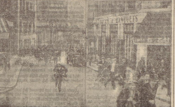
Paris am 1. Mai. Kommunistiche Demonstrationen auf der Flucht vor der Polizei. In Paris fanden anlässlich des 1. Mai im Bois de Vincennes kommunistische Demonstrationen statt, die von der Polizei gepregelt wurden.

Aus Bad Bruggenach wird gemeldet, daß über dem Lahngebiet um die gleiche Zeit ein schwerer Wolkenschlag niederging, von dem besonders die Orte jenseits Langenselmsheim und Jock betreffen wurden.