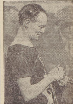
Zur Geher-Veranstaltung „Quer durch Berlin“

Der deutsche Segelflieger Kriedel flog mit seinem Segelflugzeug die 120 km lange Strecke von Griesheim nach Windbad in 3 Stunden und schraubte sich dabei auf die bisher noch nicht erreichte Höhe von 2100 Meter.