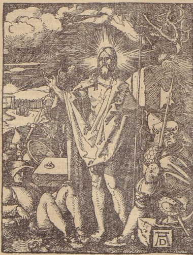
Albrecht Dürer: Auserziehung (um 1500) Kunster-Druck: Verlag Künster & Ruhhard