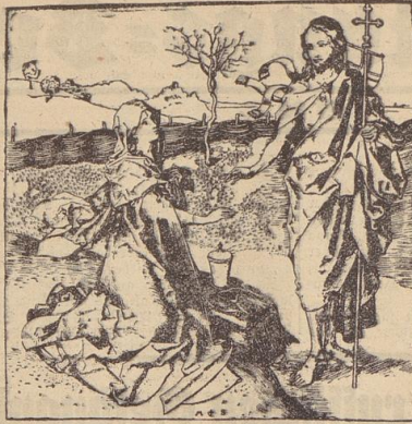
Martin Schongauer: Christus, der Maria erlöset (Ende 15. Jahrhunderts)

Es wird heller. Krähnen streichen querend vom Walde herbei, wo sie die Nacht über