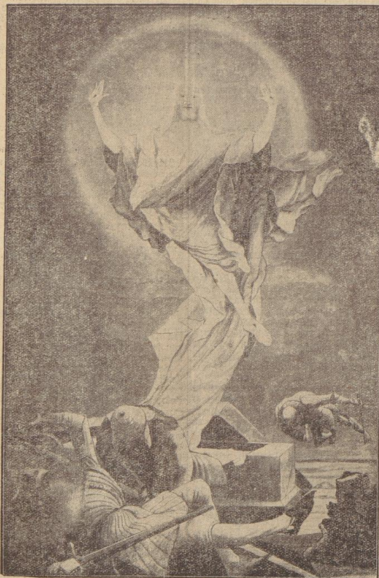
Matthias Grünewald: Auferstehung (Stenheimer Altar 1511) (Foto: Brudmann AG, München)

Aber warum habe ich meinen geliebten Bruder nicht gesehen? Wo ist er, der nach dem Tode unseres Vaters Erträrer und Beschützer ist? Schwachheit er in einem anderen Gefängnis oder sitzt er gar in einer jener hoffnungslosen Einzelzellen... Nein, nein! Wieder nicht weiterdenken. Nur nicht daran denken, nur heute vergessen das ungeschädte Leid, den Schmerz und die Trauer. Denn es ist ja heute Ostern, das Fest der Freude, der Auferstehung Jesu und der Geburt neuer Hoffnungen! S. Z.