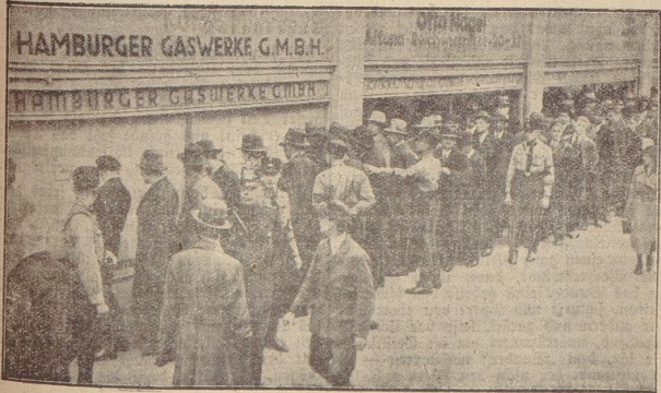
Zurückausstellung der Korruption In einer Ausstellung in Hamburg werden die Original-Belege über Festsetten von SPD-Verwaltungsbeamten gezeigt, deren Kosten oft in viele Laufende gingen. Der Andrang zu den Schaufenstern der Hamburger Gaswerke, in denen die Belege ausgestellt werden, ist sehr stark

Ein Beamter der Auskunftsstelle der Zollbehörde, der längere Zeit in Nordamerika gelebt hatte und daher sehr gut englisch sprach, fuhr eigene zu diesem Zweck nach Genue, von wo er, in einer reichen amerikanischen Millionäre verwandelt, mit dem nächsten Simons-Trip nach Istanbul zurückfuhr. Am Bahnhof deutete er dem Fremdenführer des Hotels Kataklian an, daß er ein reicher Amerikaner sei und für ein paar Tage im Hotel Kataklian Wohnung zu nehmen gedente. Man fuhr zum Hotel Kataklian, wo dem falschen Amerikaner eine Nacht von Zimmern zur Verfügung gestellt wurde. So war es dem amerikanischen Millionär nicht schwer, als bald mit den Bandenmitgliedern, die im Hotel ein- und ausgingen, in Verbindung zu treten und sie davon zu überzeugen, daß er nach der Türkei gekommen sei, um hier größere Mengen von Heroin zu kaufen. Der von den Mitgliedern der Bande angefangen vom Amerikaner geforderte Preis von 1200 Türkpfund für das lg wurde von ihm als zu hoch abgelehnt und nach langem Hin und Her einigte man sich auf einen Preis von 800 Türkpfund bei einer Mindestabnahme von 100 Kilo Heroin. Die von den Mitgliedern der Bande geforderte Anzahlung von 4000 Türkpfund wurde vom Amerikaner glatt auf den Tisch gezahlt und die Bande war froh, einen fetten Käufer gefunden zu haben. Die Führer der Bande,