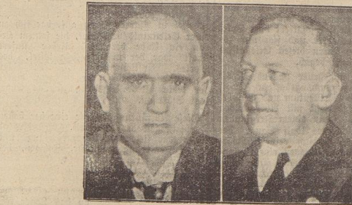
Neue Regierung in Bayern Ministerpräsident Hg. Siebert (links) und Innenminister Hg. Adolf Wagner