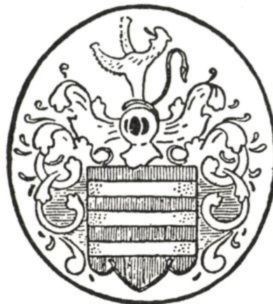
Wappen der Familie Böhm