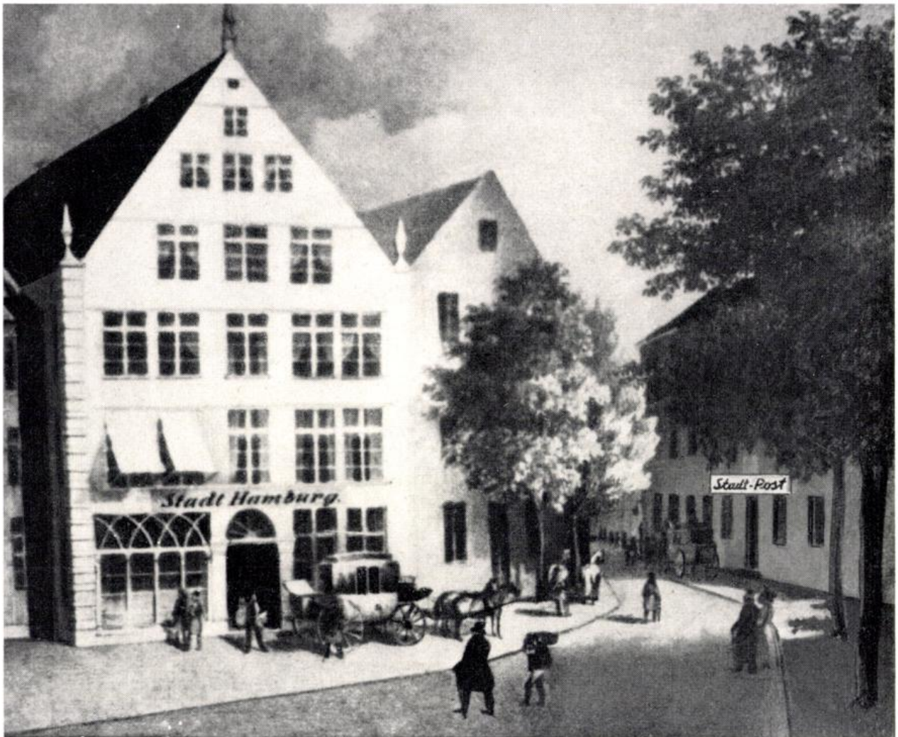
Unser Lieben Frauen Kirchhof

Links: „Hotel Stadt Hamburg“ mit Fahrpost Rechts: „Stadtbremisches Postamt“ im Stadthaus