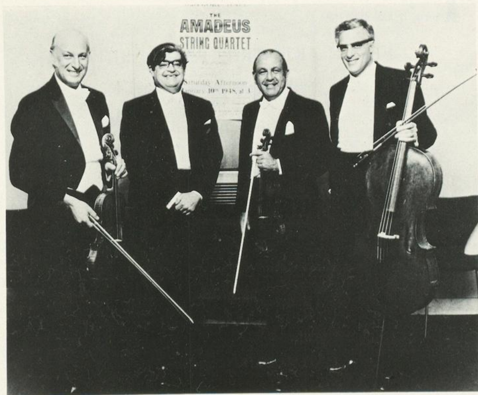
Bremer Debut: Vor 25 Jahren, am 21. Oktober 1950